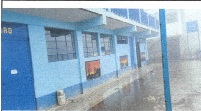
Foto1: SUSTITUCION DE BALCONES